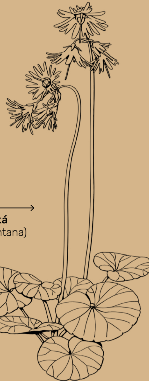
Dřípatka horská ( Soldanella montana )

Dřípatka se dokáže vyvíjet a růst i pod sněhem a proto vykvétá tak brzy zjara. Královna zima však nevzdává se lehce. Do něžných kvítků zatnula své spáry a „rozdřípila“ je, jak vidíme na obrázku.