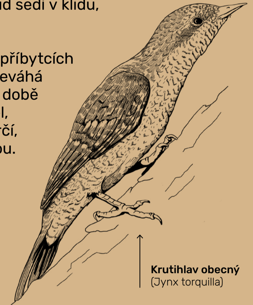
Krutihlav obecný ( Jynx torquilla )

Hnízdí v dutinách, často v opuštěných příbytcích jiných ptáků nebo v budkách, z nichž neváhá vyhodit původní obyvatele. Pokud se v době hnízdění přiblíží k jeho příbytku nepřítel, krutihlav začne syčet a funět, jemně vrčí, načepýří peří a zvolna točí a kývá hlavou. Dokáže ji otočit až o 180° a podle této schopnosti dostal také své jméno. Živí se převážně mravenčími vajíčky, kuklami i dospělými mravenci, které nalepuje na svůj dlouhý a daleko vysunutelný jazyk. Sbírá i housenky a drobný hmyz a na podzim bobule černého bezu. Na zimu odlétá do rovníkové Afriky.