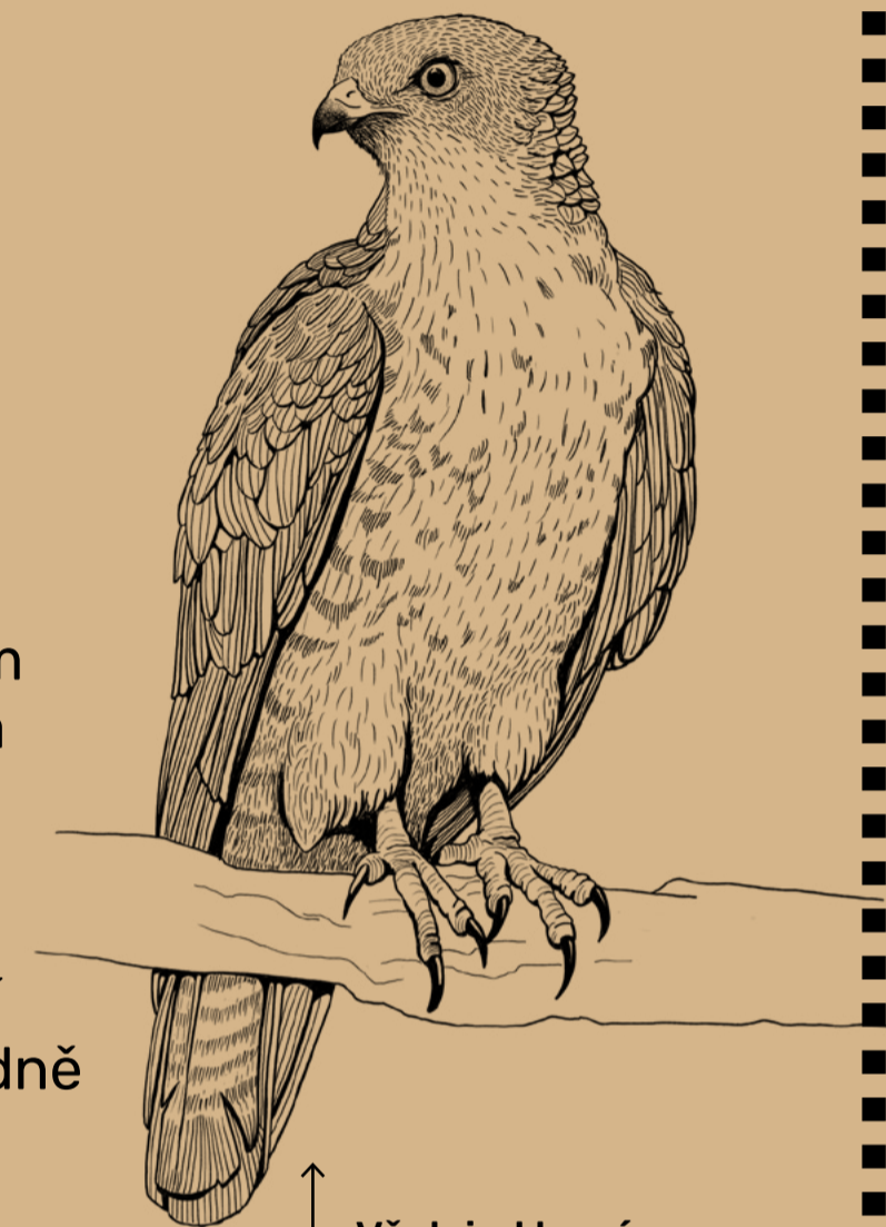
Včelojed lesní (Pernis apivorus)

V potocích bývali i raci, jejich počet však klesá v důsledku znečištění vody a rozmnožení vydry říční, která je jim přirozeným nepřítelem.